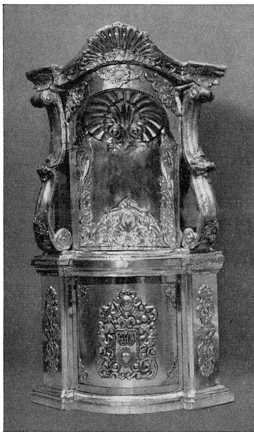
Barock-Tabernakel aus meiner Werkstatt (Auslandauftrag)

Seit 65 Jahren bei der Hofkirche und Lokalmieter des Stiftes zu St. Leodegar.