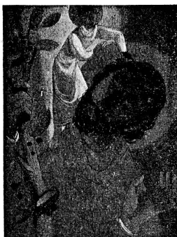
Christophorus , nach einem Unterglasgemälde von J. Schwegler, auf Holz, 23,5×18 cm. Fr. 9.80.