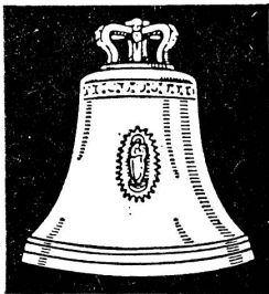
Aarauer Glocken seit 1367

Verlangen Sie bitte unverbindlichen Besuch mit Beratung und Offerte. Tel. 042/4 10 68