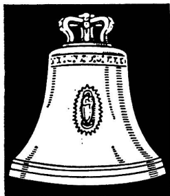
Aarauer Glocken seit 1367

Schluss der Inseratenannahme: Montag 12.00 Uhr.