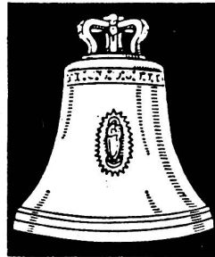
Aarauer Glocken seit 1367

Reisegenossenschaft der Christlichen Sozialbewegung