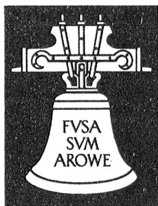
Aarauer Glocken seit 1367