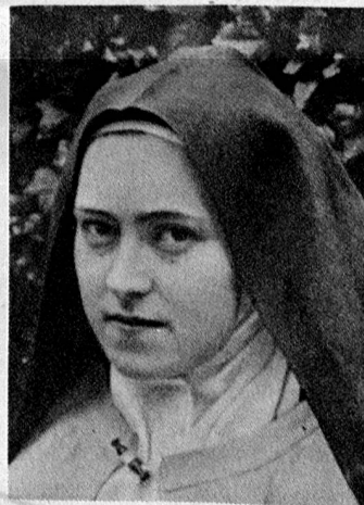
Nur die Liebe zählt