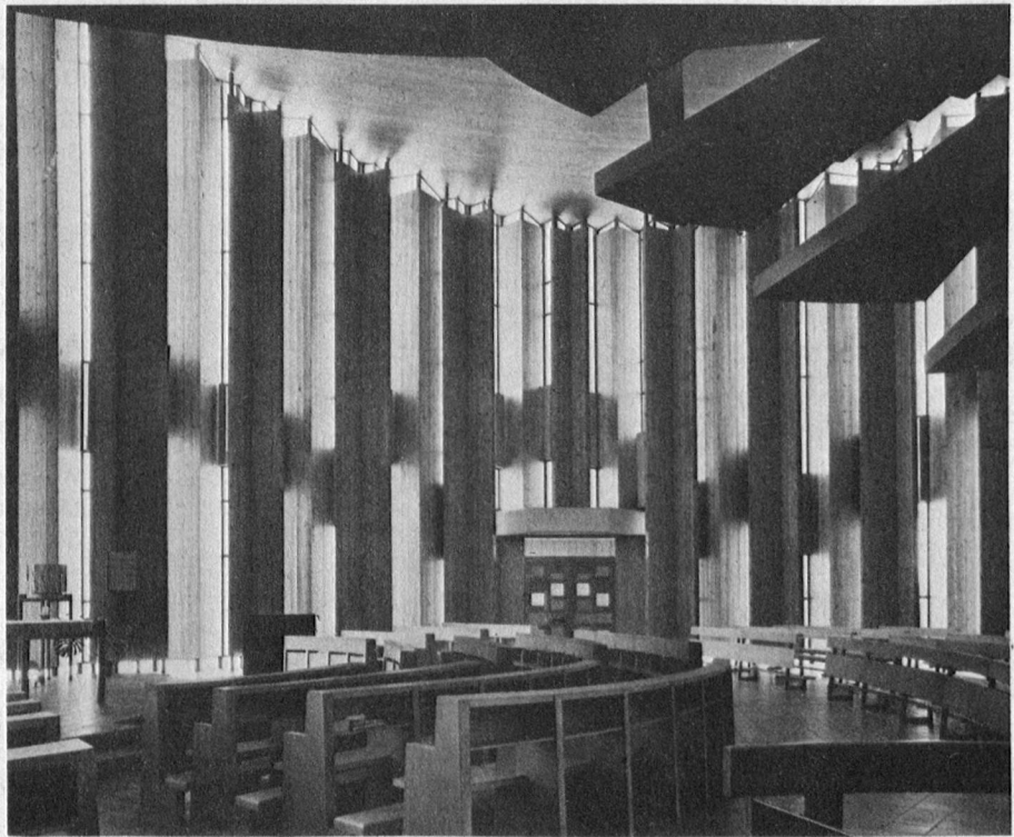
Kapelle mit Treppe zur Empore

Die Schwestern, die den Auftrag als Missionarin haben, suchen mit Vorliebe die Menschen in hoffnungslosen Milieu auf: Gefangene, Prostituierte und aller Art moralisch Arme. Sie kommen dadurch der Idee des Gründers am nächsten: zu hoffen gegen alle Hoffnung. Die Schwesterngemeinschaften von Bethanien sehen es als ihre Pflicht, den moralisch Ärmsten in der Gesellschaft beizustehen, sei dies durch brieflichen Kontakt, durch Ermöglichung eines Aufenthaltes in ihrem Gästehaus, oder sogar durch das eine-zeitlange Mitleben mit den Schwestern. Im Bewusstsein, dass alle durch Christus erlöst sind, wollen sie innerhalb der Kirche, als eigenes Ordens-Institut, ein lebendiges Zeugnis des Glaubens an die Allmacht der Gnade sein. pe