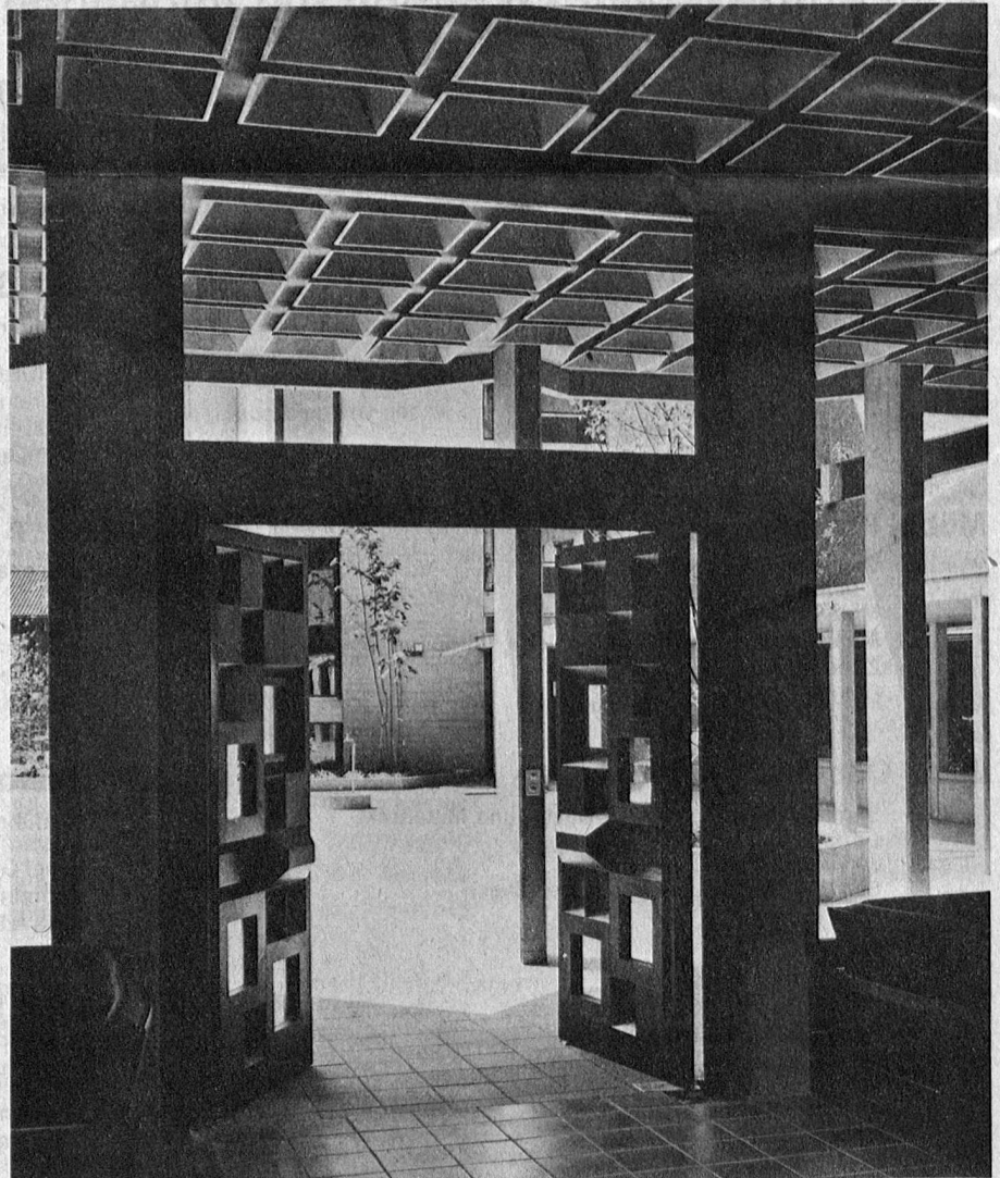
Haupteingang mit Blick gegen Hof ▶

Vom ersten Kontakt an lernten wir die überströmende Gastfreundschaft, der Schwestern kennen. Ihr selbstloser und hingebender Einsatz um das Wohl der Gäste wurde uns Leitmotiv für die Planung. Es sollte ein Bau entstehen, der Geborgenheit und Wärme mit Grosszügigkeit und Befreiung verbindet. Der durchaus ungewöhnliche Ein-