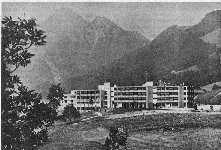
Gesamtansicht von Westen