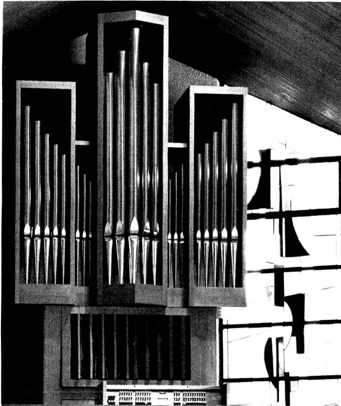
NEUE ORGEL PFARRKIRCHE HOHENRAIN / LU

W. Cadonau + W. Okle Telefon 073 - 22 37 15