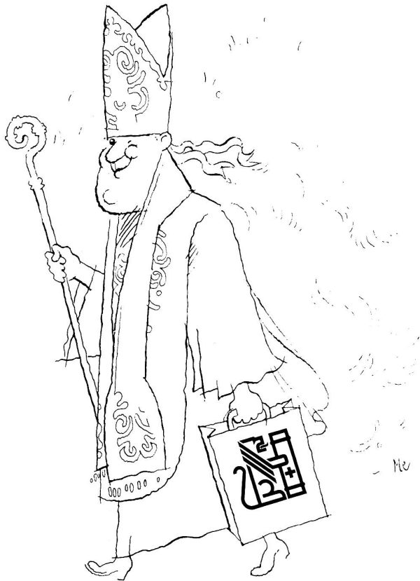
Leobuchhandlung Gallusstrasse 20 9001 St.Gallen

W. Cadonau + W. Okle Telefon 073 - 22 37 15