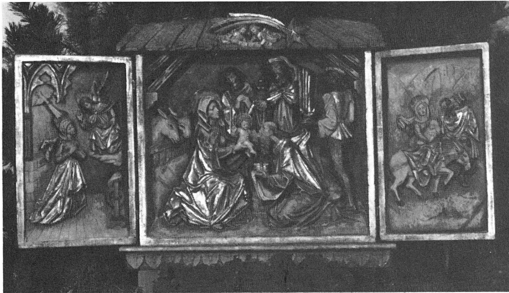
Triptychon (geschlossen ca. 80×80 cm) antik gefasst, nach Veit Stos, Kastanienholz, Handarbeit, Einzelstück, hervorragend bemalt.

Wir erwarten gerne Ihren Besuch in Einsiedeln . Mit höflicher Empfehlung