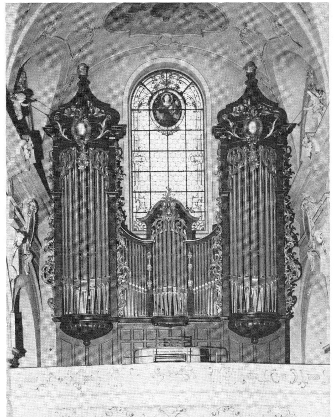
Pfarrkirche Eschenbach LU

Zu beziehen durch: Buchhandlung Raeber AG, Frankenstr. 9, 6002 Luzern, Telefon 041 - 23 53 63