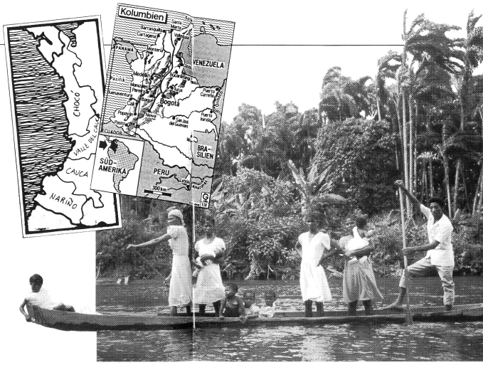
Die kolumbianische Pazifikküste ist 1 300 km lang und umfasst ein Gebiet von 73 000 km 2 , in welchem etwa eine Million Menschen leben. Vier Fünftel von ihnen sind afrikanischer Herkunft. Das Departement Choco, mit seinem einzigartigen, intakten Regenwald am mittleren Atlantik ist 43 000 km 2 gross.

Die Frauen spielen in unserer Gesellschaft auch eine wichtige Rolle. Sie bestimmen im Haus geben die Kultur weiter und balancieren die Beziehungen in unserer Gesellschaft aus.