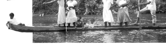
Die kolumbianische Pazifikküste ist 1 300 km lang und umfasst ein Gebiet von 73 000 km 2 , in welchem etwa eine Million Menschen leben. Vier Fünftel von ihnen sind afrikanischer Herkunft. Das Departement Choco, mit seinem einzigartigen, intakten Regenwald am mittleren Atlantik ist 43 000 km 2 gross.

Denn ein Mann hat mehrere Frauen, zwei oder drei. Darum ist es die Frau im Haus, die für Ordnung sorgt und die Beziehungen regelt. Deswegen haben wir auch viel beizutragen zum Aufbau einer neuen Gesellschaft.