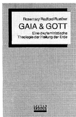
Eine ökofeministische Theologie der Heilung der Erde Edition Exodos Fr. 47.–