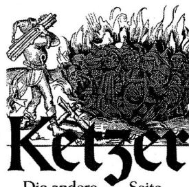
Die andere Seite des frühen Christentums