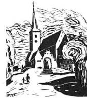
Röm.-Kath. Kirchgemeinde Therwil/Biel-Benken (BL)

Würde mich gerne in der betreffenden Pfarrei niederlassen, um am Pfarreileben ganz teilnehmen zu können. Ich freue mich auf Ihre Kontaktnahme unter Chiffre 1790 oder Telefon 055 - 640 21 13. (Sie werden vermittelt.)