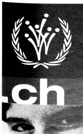
2001 Internationales Jahr der Freiwilligen www.iyv-forum.ch