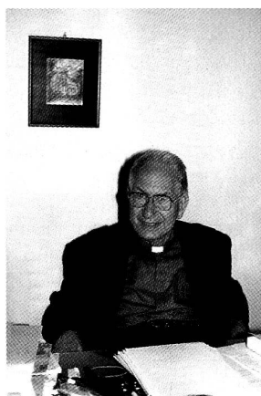
Erhält am 21. Oktober die Kardinalswürde: der Schweizer Theologe Georges Cottier.

Nach Charles Journet im Jahre 1965, dem Einsiedler Abt Benno Gut 1967, dem Theologen Hans-Urs von Balthasar