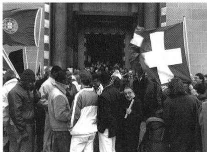
Ausklang eines Migranten-Gottesdienstes in Freiburg

Verschiedene Redner von Fremdsprachigenmissionen warnten, Ausländer, die einer Schweizer Landessprache nicht kundig seien, könnten zu Sekten abwandern, weil sich diese mehr um die Zugewogenen kümmerten als die katholische Kirche. (kipa)