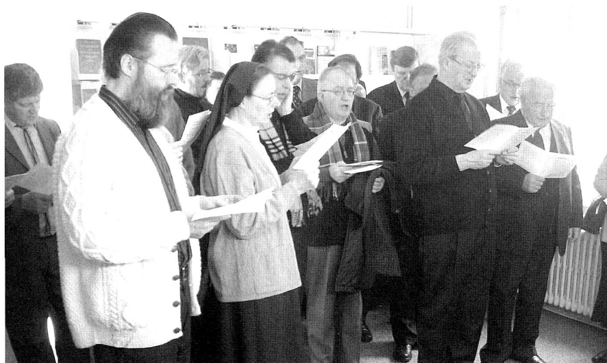
Mitfeiernde bei der Einsegnung der Räume des Liturgischen Instituts.