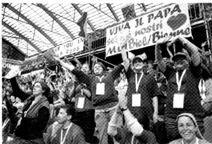
Am nationalen Jugendtreffen entstand nur finanziell ein Defizit.

Das gerade begonnene Jahr der Eucharistie, das Papst Johannes Paul II. proklamierte, ist nach Meinung der Bischöfe "auch für die Schweiz von hoher Wichtigkeit". Vielen Christen werde dadurch Gelegenheit gegeben, die grosse Bedeutung der Eucharistie neu zu entdecken. Es bestehe aber die Gefahr, dass