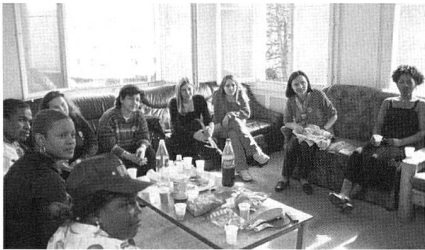
Entspanntes Gespräch

Am Anfang stehen Äplermakkaronen, ein Birchermüesli oder auch Spaghetti. Denn jeder der zehn Kursabende beginnt mit einem gemeinsamen Essen. Es ist eine gute Gelegenheit, "sich besser kennen zu lernen, sich in aller Freiheit