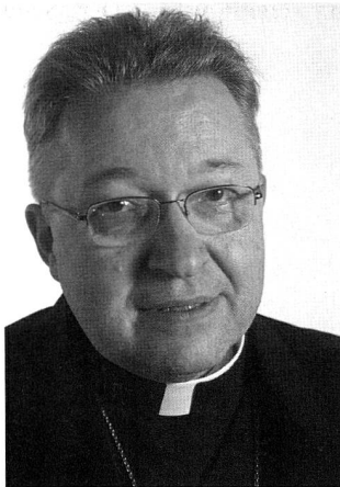
André Vingt-Trois

Der schon äusserlich eher bullig und massiv wirkende Erzbischof hat in der Tat immer wieder eine deutliche Sprache gefunden, um kirchliche Positionen zum Ausdruck zu bringen. Im Januar kritisierte er die seit 30 Jahren geltende Fristenregelung beim Schwangerschaftsabbruch in Frankreich. Abtreibung sei