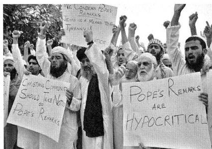
In Indonesien: Heftige Proteste gegen die Papst-Äusserungen.

Zwar wiederholte ein sichtlich angespannter Papst vor dem Angelus-Gebet nur, was sein neuer "zweiter Mann" bereits in einer Erklärung vom Vortag betonte. Er entschuldigte sich nicht, bedau-