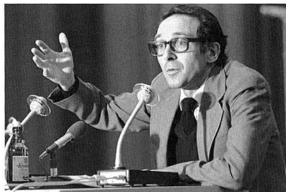
Der Jesuit Jon Sobrino

Gründe für die Verzögerung gab es viele. So liess sich Sobrino ein halbes Jahr Zeit, um auf ein Schreiben der Kongregation zu antworten. Von Rechts wegen standen ihm zwei Monate zu. Dann kam der Wechsel von Kardinal Joseph Ratzinger ins Papstamt. Dessen Nachfolger als Präfekt der Glaubenskongregation, Kardinal William Levada,