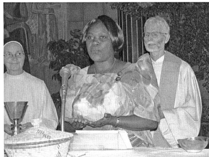
Gottesdienstfeier mit Laien

Deswegen richtet er deutliche Worte an die Priester, verlangt von ihnen mehr Feierkultur, bessere Predigten und weniger Entertainment. Der Zelebrant soll sich nicht in den Mittelpunkt stellen, sondern die Begegnung mit dem Geheimnis des Glaubens ermöglichen. Eine