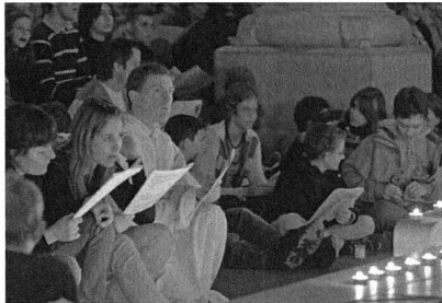
An den Feiern nahmen auch Brüder aus Taizé (Bild) teil.

Zürich. – Eine grosse Anzahl Jugendlicher hat an der "Nacht der Lichter" teilgenommen. Im Zürcher Grossmünster waren es 800, im Kanton Solothurn über 300. Bei der nächtlichen Besinnung in der Kathedrale Solothurn war das Gotteshaus vollbesetzt. Im Mittelpunkt der Feiern standen die berühmten Lieder und Gesänge der Taizé-Gemeinschaft aus dem Burgund. Ende Jahr findet in Genf ein internationales Taizé-Jugendtreffen statt. (kipa)