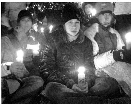
Stimmungsbild vom Ranfttreffen 2004.

Ein weiterer Grund, der für den Rückgang der Teilnehmerszahlen häufig genannt werde, sei die unweatherbedingte zeitweise Sperrung der Ranftschlucht. Der Feierplatz im Flüeli