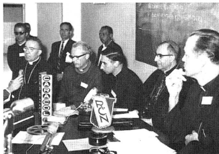
Seit Medellin im Blick: Lateinamerika und die Befreiungstheologie

Es sei sicher entscheidend, dass die Konferenz kurz nach dem Zweiten Vatikanischen Konzil stattfand, meint Assis: "Die Zeit war geprägt vom Kalten Krieg. In Lateinamerika gab es zahlreiche Diktaturen, und in Kuba lag die Revolution noch nicht sehr lange zurück. All dies waren die Begleitumstände der Zusammenkunft."