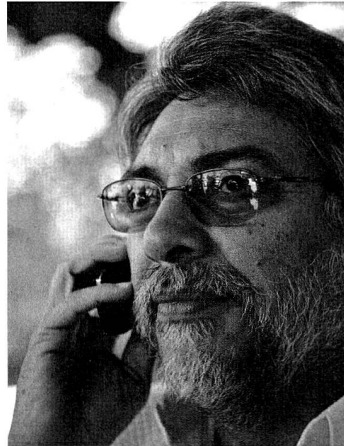
Fernando Lugo, jetzt Staatspräsident

Zu manchen Positionen der Amtskirche hatte Lugo indes schon vorher ein eher distanzierendes Verhältnis. Er bekennt sich offen zur Befreiungstheologie und gilt als Vertrauter des Brasilianers Leo-