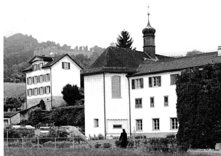
Kloster Maria Hilf in Altstätten