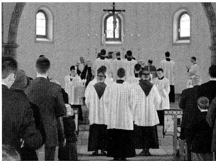
Die Weihen der Priesterbruderschaft wären nicht erlaubt gewesen.

Die Eucharistiefeier stellte der Generalobere in den Mittelpunkt des Lebens eines jeden Christen. Während des Gottesdienstes drehe der Priester dem Volk den Rücken zu, aber nicht Gott. Auf diese Weise rechtfertige sich die Praxis der Kirche, die vor dem Zweiten Vatikanischen Konzil Gültigkeit hatte. Gott