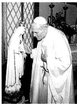
Johannes Paul II. in Fatima

Fatima steht in einem Netzwerk mit den anderen grossen marianischen Pilgerorten Europas: Städtepartnerschaften verbinden den Ort mit Tschestochau in Polen, Lourdes in Frankreich, Loreto in Italien, Mariazell in Österreich und Altötting in Bayern. Überall dort war Benedikt XVI. schon; Fatima ist die letzte Station. (kipa)