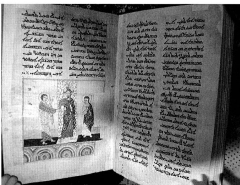
Restaurierte syrische Handschrift mit der Darstellung des ungläubigen Thomas (alle Fotos: Franz Mali).