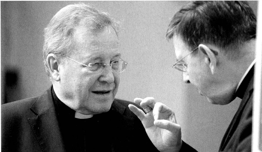
Walter Kasper (links), scheidender Präsident des päpstlichen Einheitsrates, im Gespräch mit seinem Nachfolger Kurt Koch.