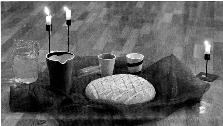
Feierabendgottesdienst: Ein Tuch wird zum Tisch für Brot, Wasser und Wein

Luzern. – Es ist ein paar Minuten nach sechs an einem Werktag abends. Durch den Bahnhof Luzern schieben sich Pendlere auf der Zentralstrasse staut sich der Verkehr. Es ist Feierabendzeit, viele machen sich auf den Weg nach Hause. Ein paar Minuten und nur eine Seitenstrasse weiter: die Lukaskirche. Kerzenlicht erhellt den angenehm grosszügigen und freundlichen Kirchenraum. Noch sind die Stühle im Altarraum leer, probt ein Paar einen Tango, werden Liedzettel ausgelegt und im Eingang Gläser für den Apéro hergerichtet.