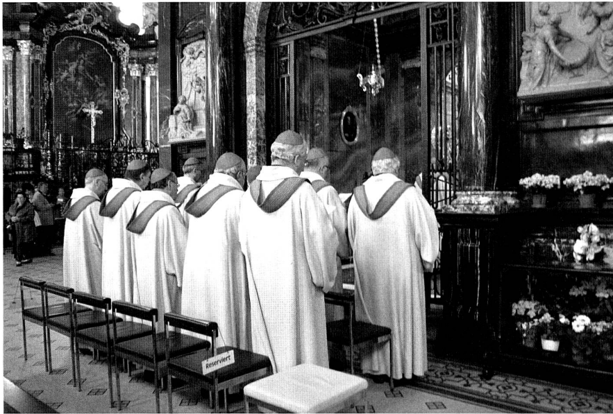
Die Schweizer Bischöfe vor der Gnadenkapelle in Einsiedeln.