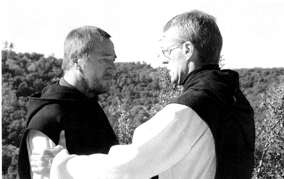
Bruder Christian (Lambert Wilson, rechts) im Gespräch mit Bruder Christophe (Olivier Rabourdin).