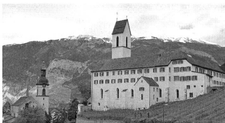
Konflikte gibt es auch in der Frage der Priesterausbildung an St. Luzi in Chur.

Gemäss der Darstellung von Binotto versucht das Bistum mit allen Mitteln, den Konflikt um die tridentinische Messe unter Verschluss zu halten. So habe