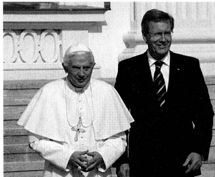
Papst Benedikt XVI. und der deutsche Bundespräsident Christian Wulff

Bei zwei internen Begegnungen, erst mit dem Zentralkomitee der deutschen Katholiken und dann mit einigen hundert Vertretern aus Kirche, öffentlichem Leben, Politik und Religion, wurde er noch deutlicher. Zwar lobte er das Engagement vieler haupt- und nebenamtlicher Katholiken, warnte aber vor der Gefahr, die Bedeutung des kirchlichen Apparats zu überschätzen oder sich auf die in Deutschland vorhandene Unterstützung durch den Staat zu verlassen.