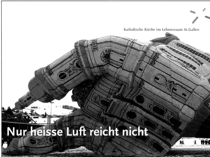
Katholische Kirche im Lebensraum St.Gallen

Bahnhofstrasse 50 | 5507 Mellingen Tel. 056 481 77 18 megatron@kirchenbeschallungen.ch