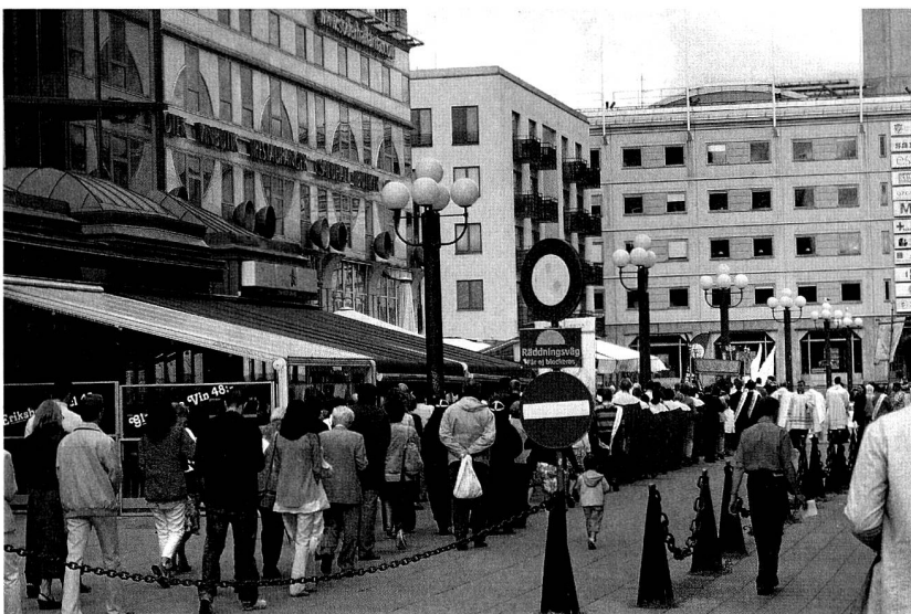
Foto: Fronleichnamspirozession in der schwedischen Hauptstadt Stockholm

tion zu bauen, damit eine gefestigte katholische Gemeinschaft heranwachsen kann.