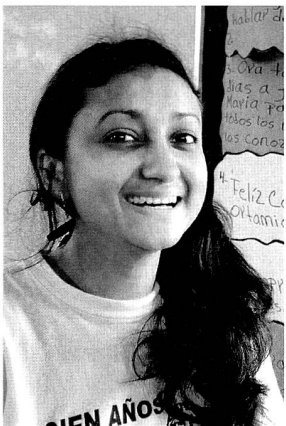
Gastkirche am Weltmissionssonntag 2011 ist Nicaragua. Die Kirche ist jung und vernetzt und gibt den Menschen in einem der ärmsten Ländern Lateinamerikas Hoffnung.

Heute ist dies nicht anders. In der Verkündigung des Evangeliums sind Menschen mit unterschiedlichen Charakteren tätig. Der Auftrag, bis «an die Grenzen der Erde» zu gehen, hat seine Gültigkeit nicht verloren. Mit welchen konkreten Herausforderungen die Menschen an diesen Rändern leben und wie sie diese bewältigen, versucht «Missio» im Monat der Weltmission zu zeigen. Jedes Jahr wird eine Gastkirche und das Leben seiner Gläubigen in den Fokus gerückt. In diesem Jahr ist es das zentralamerikanische Nicaragua, eines der ärmsten Länder Latein-