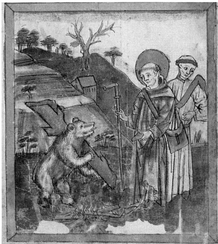
Szene aus der Galluslegende: Gallus reicht dem Bären das Brot und der Bär bringt ihm Holz.

St. Gallen. – Ein Mann des 7. Jahrhunderts erweist sich als erstaunlich lebendig: Kanton, Stadt, Bistum, Katholischer Konfessionsteil, reformierte Landeskirche und Tourismusverband spannen zusammen, um "ihren" Gründungsheiligen zu feiern. Am 20. April beginnt das Gallusjahr mit einem Festakt und drei Auftaktwochen.