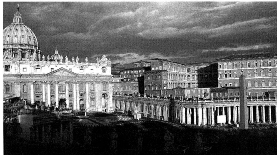
Vatileaks-Affäre: Wolken über dem Vatikan