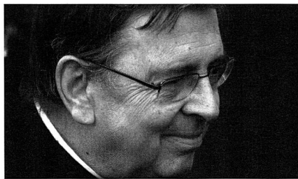
Kardinal Kurt Koch, Präsident des päpstlichen Einheitsrates

Man müsse sich auch bewusst sein, dass Europa nicht mehr der Mittelpunkt