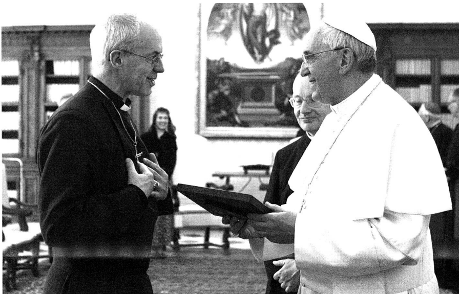
Papst Franziskus hat am 14. Juni den Erzbischof von Canterbury, Justin Welby, im Vatikan empfangen.