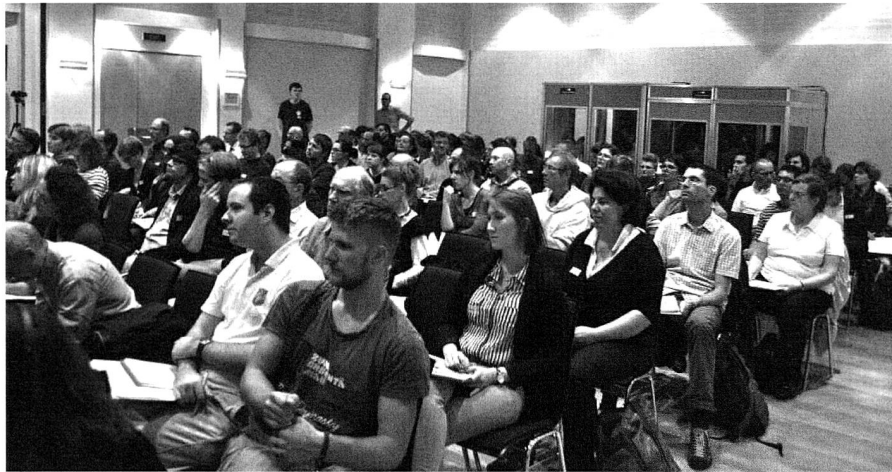
Der Grad an Betroffenheit ist gestiegen: Der Saal musste vergrössert, einigen Interessierten musste abgesagt werden.

Brot für alle und Fastenopfer fordern Transparenz in der Rohstoff-Lieferkette und so idealerweise die Abschaffung sozialer Missstände in den Zuliefererfirmen. Denn "Konfliktmineralien", also Mineralien, welche aus Minen in einem Kriegsgebiet stammen, sind heute in jedem Mobiltelefon enthalten. Ein Handy besteht aus fast 60 verschiedenen Mineralien. 96 Prozent der Weltbevölkerung verfügen über einen registrierten Mobiltelefon-Anschluss – die Nachfrage nach den Rohstoffen ist enorm. Laut