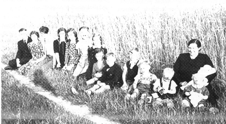
Kinderreiche Familie um 1950: Das Familienbild hat sich seither stark verändert

Rom. – Es ist eine ungeschönte Bestandsaufnahme zu einem Thema, in dem katholische Positionen und gesellschaftliche Praxis auseinanderdriften. Der Vatikan hat am 26. Juni das Arbeitspapier für die nächste Weltbischofssynode vorgelegt, die sich im Oktober den «pastoralen Herausforderungen im Hinblick auf die Familie» stellen will.