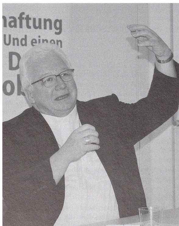
Bischof Markus Büchel

Der St. Galler Bischof und Präsident der Schweizer Bischofskonferenz Markus Büchel äusserte sich am Donnerstag, 5. Februar, an einem Mediengespräch zu aktuellen Entwicklungen in der katholischen Kirche. Es sei möglich, dass es künftig in einer Stadt nur noch zwei Eucharistiefeiern pro Wochenende gebe. Zum Vergleich: Laut Angaben des Bischofs wird heute an einem Wochenende in der Stadt St. Gallen an 20 verschiedenen Orten eine Eucharistiefeier angeboten. (bal)