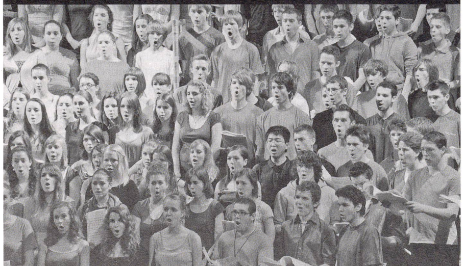
In Bern fand vergangene Woche der V. Internationale Kongress für Kirchenmusik statt. Der Grossanlass bot Referate, Podiumsgespräche und Workshops. An täglichen Laudes, mittäglichen Orgelmeditationen und zahlreichen Konzerten wirkten zudem rund 600 Personen mit. Für den wissenschaftlichen Teil hatten sich rund 120 Personen angemeldet. Im Bild: Chor des Gymnasiums Neufeld in Bern.