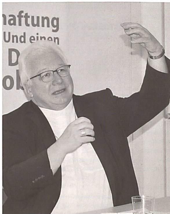
Bischof Markus Büchel

Der St. Galler Bischof und Präsident der Schweizer Bischofskonferenz Markus Büchel äusserte sich am Donnerstag, 5. Februar, an einem Mediengespräch zu aktuellen Entwicklungen in der katholischen Kirche. Es sei möglich, dass es künftig in einer Stadt nur noch zwei Eucharistiefiern pro Wochenende gebe. Zum Vergleich: Laut Angaben des Bischofs wird heute an einem Wochenende in der Stadt St. Gallen an 20 verschiedenen Orten eine Eucharistiefier angeboten. (bal)