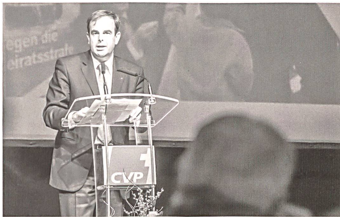
Der Zuger Nationalrat Gerhard Pfister (53) ist auch Präsident der Kageb, der Katholischen Arbeitsgemeinschaft für Erwachsenenbildung.

Mit Gerhard Pfister wird in kurzer Zeit ein Politiker an der Spitze der CVP Schweiz stehen, der mit seiner katholischen Herkunft nicht hinter dem Berg hält. Der Zuger Nationalrat ist Präsident der Kageb, der Katholischen Arbeitsgemeinschaft für Erwachsenenbildung der Schweiz und Liechtensteins, und spricht in Sachen Kirche Klartext.