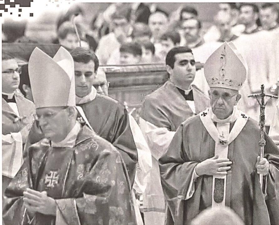
Papst Franziskus an der Abschlussmesse der Synode 2015