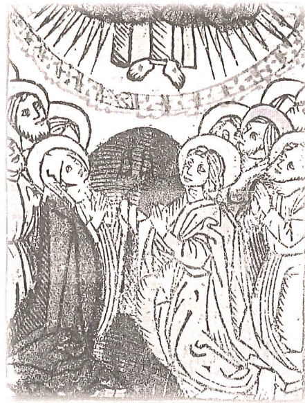
Anonym, Himmelfahrt Christi, wohl 16. Jhdt.