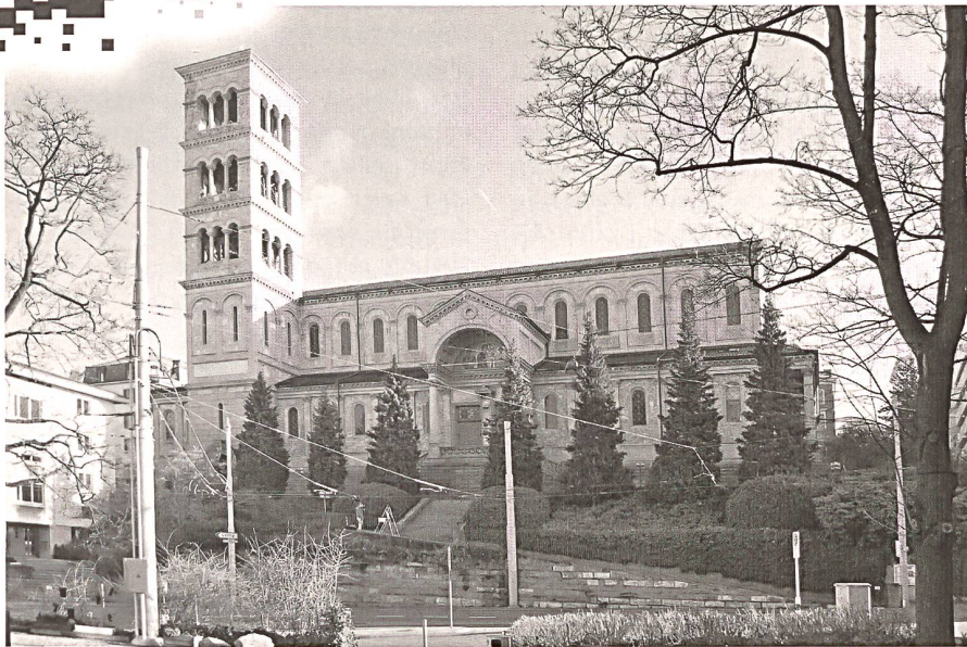
Liebfrauen in Zürich wird voraussichtlich nicht Kon-Kathedrale.