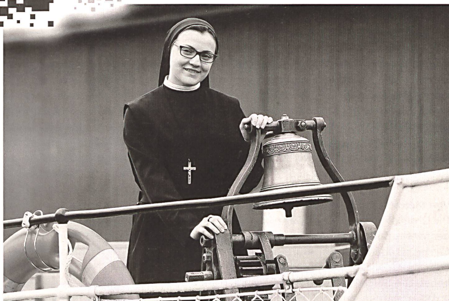
Suor Cristina