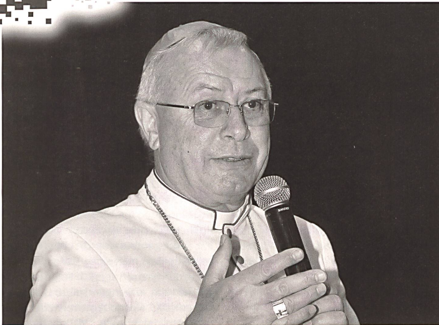
Bischof Paul Hinder lobt das Engagement der Gläubigen in den Emiraten.