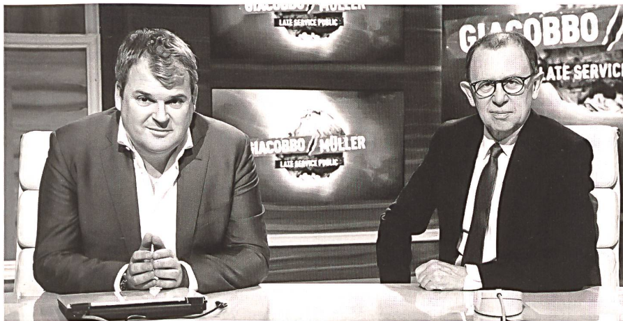
Satiresendung Jacobbo/Müller mit Mike Müller (l.) und Viktor Jacobbo.