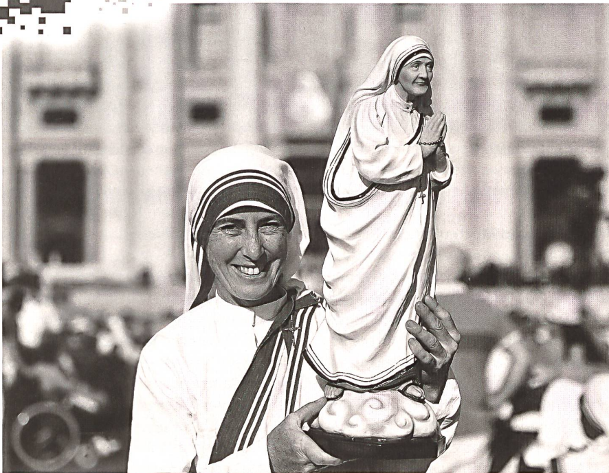
«Missionarin der Nächstenliebe» mit Mutter-Teresa-Figur an deren Heiligsprechung.