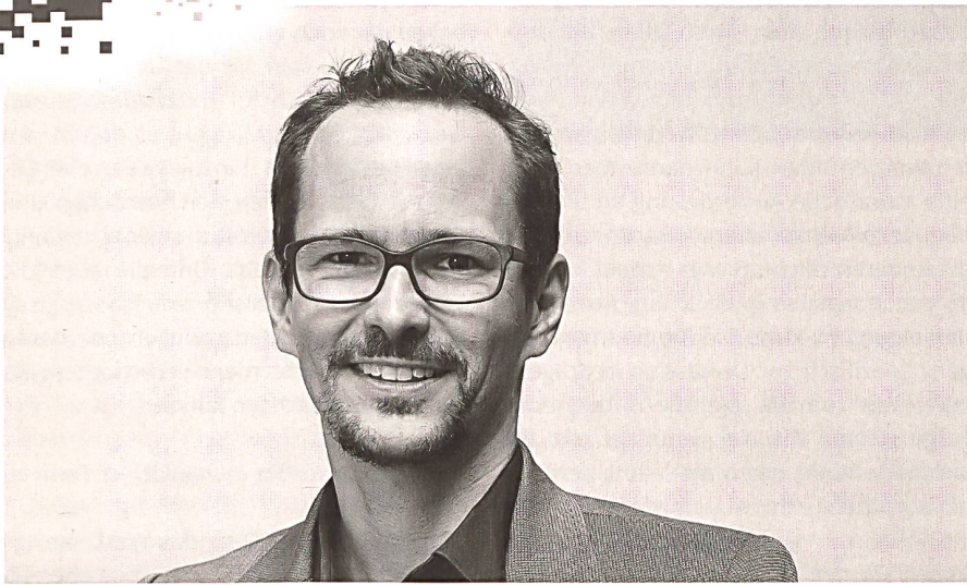
Balthasar Glättli