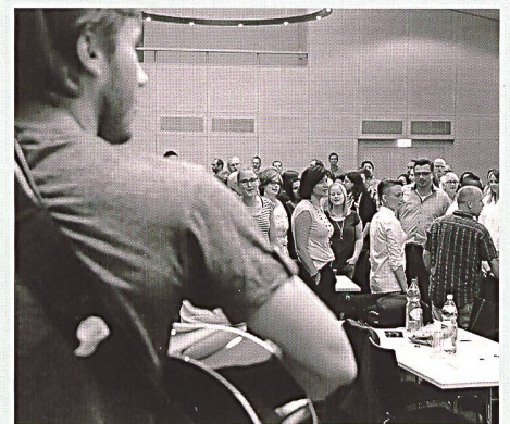
Gemeinsames Musizieren beim Firmbegleitungs-Treffen.

Seit 2011 ist die Firmung im jungen Erwachsenenalter im Bistum St. Gallen flächendeckend umgesetzt. Durchschnittlich gut zwei Drittel der angeschriebenen jungen Erwachsenen machen sich mit weit über 300 ehrenamtlichen Firmbegleiter/-innen und Seelsorgenden im Bistum gemeinsam auf den Firmweg. Dieser umfasst mehrere Treffen (an Abenden oder auch am Samstag, je nach Arbeitssituation der Firmlinge), in der Regel ein Wochenende und bei den meisten Firmgruppen auch eine Firmreise. «Mein Leben leben», «meinen Glauben leben», «gute Zeichen – Taufe und Firmung», «Leben, Tod und Auferstehung», «Gott als Geist unter uns» sind für den Firmweg vorgegebene Themen. Dazu werden aktuelle Fragen aufgegriffen wie Migration oder Sterbehilfe. Meist gehört zusätzlich ein sozialer Einsatz in der Seelsorgeeinheit zum Firmweg. Vor der Firmung bekennen sich die Firmandinnen und Firmanden in einem öffentlichen Ja zu ihrem Weg, als Letztes spenden Bischof Markus Büchel oder Generalvikar Guido Scherrer die Firmung.