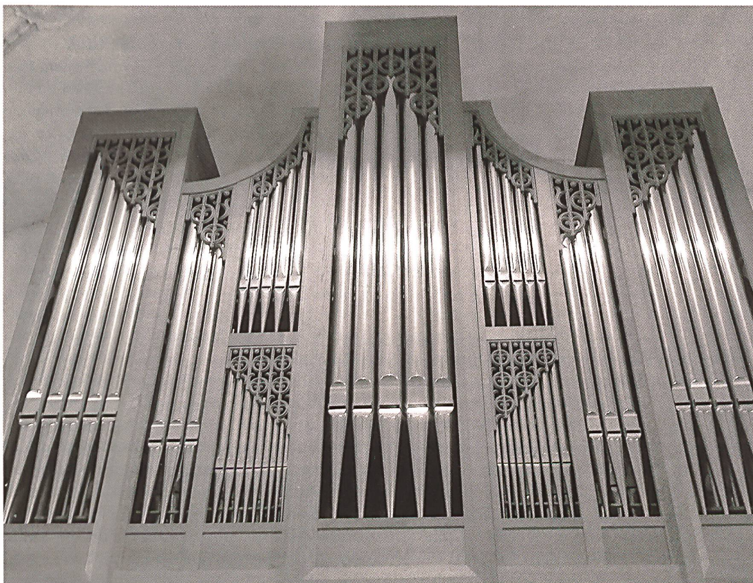
Orgelprospekt St. Mauritius Emmen.

Jenseits der angesprochenen Spannungen geht die Suche nach Öffnung zur Vielfalt an Musikstilen in der Praxis des Gottesdienstes mit Menschen unterschiedlichsten Alters und Herkunft weiter. Dies veranlasst zur vertieften Reflexion über Ideale, Praxen und Möglichkeiten musikalischer Umsetzung in gottesdienstlichen Feiern. Der Bedarf nach Integration neuer Musikstile und -formen bei der Feier christlichen Glaubens ist nicht vernachlässigbar. Im Kontrast dazu zeigt sich dagegen die Sichtweise auf Ebene der römisch-katholischen Weltkirche. Zwei Päpste aus dem europäischen Kulturraum haben ihre persönlichen Standpunkte markiert. Sie liessen meines Erachtens die erforderliche Öffnung auf die Vielfalt von Gesellschaften und Kulturen vermissen.