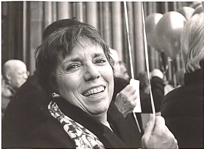
Reformations- botschafterin Margot Kässmann in Basel