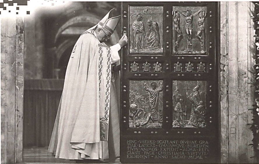
Papst Franziskus schliesst die Heilige Pforte des Petersdoms