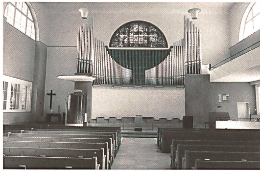
Reformierte Kirche Heiden, Appenzell Ausserrhoden.

für alle Mal geopfert. 18 Ein Fegefeuer nach der irdischen Lebenszeit gebe es nicht, und das Abendmahl «nach dem Wort Gottes» solle allen Gläubigen in Gestalt von Brot und Wein zugänglich sein.