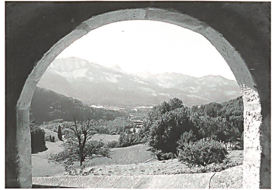
«Die Zukunft beginnt jetzt»: Blick ins Greyerzerland.