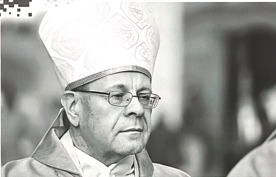
Die Nachfolge des Churer Bischofs Vitus Huonder steht an